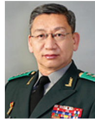
전 동 운