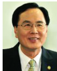
노 대 래