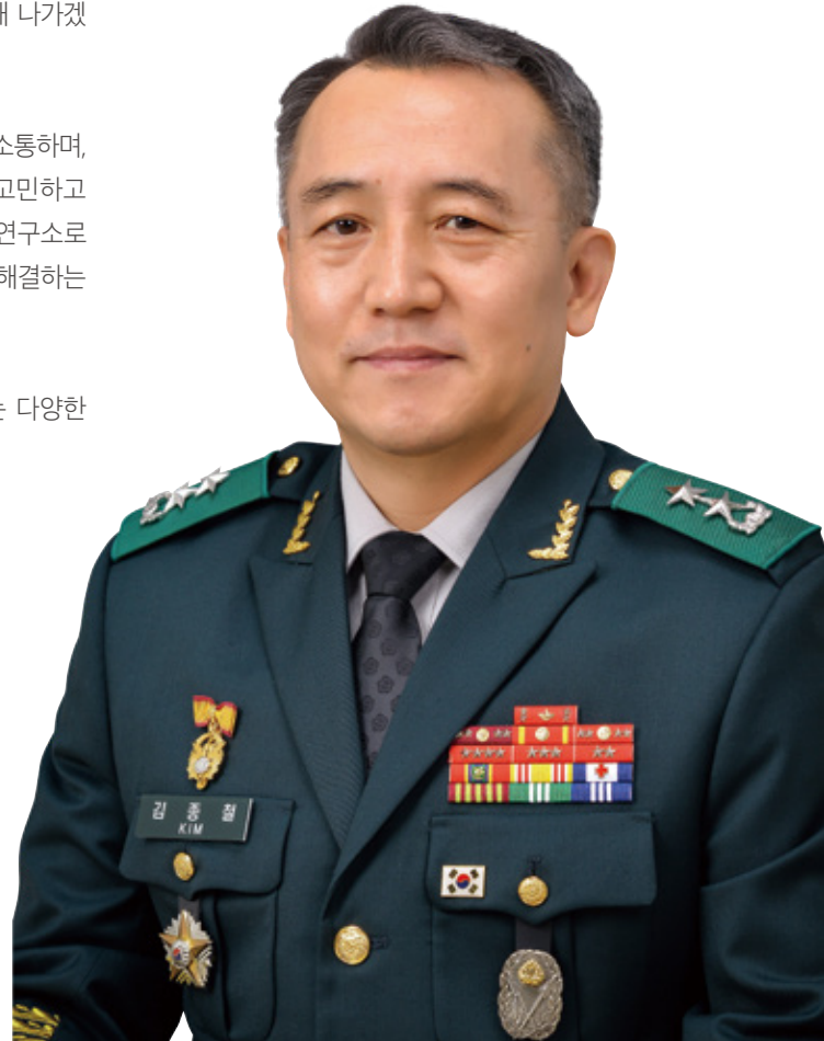
국방대학교 총장 겸 국가안전보장문제연구소장 육군소장 김 종 철

오늘날 한반도가 직면한 세계적, 지역적 안보환경 변화속에서, 다가오는 다양한 위기들을 해결하기 위해서는 지혜와 슬기가 필요합니다. 한반도의 평화와 번영을 위해서는 올바른 국가안보정책이 수립되어야 하고, 그 중심에서 RINSA가 제 역할을 할 것입니다. RINSA가 그 사명을 다할 수 있도록 여러분 모두의 관심과 따뜻한 성원을 부탁드립니다.