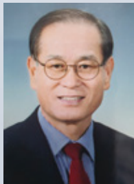
이 성 출

The Board of Advisors is composed of highly distinguished and accomplished leaders in South Korea and provides overall direction and supports for RINSA. They also help events of RINSA be more successful by attending and making practical and constructive suggestions for those events.